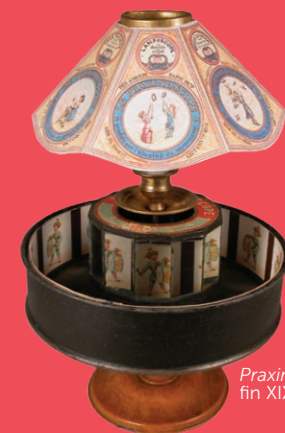
Praxinoscope, fin XIX e siècle

Conservatoire et observatoire de l'éducation : outils et méthodes d'enseignement depuis Jules Ferry, instruments scientifiques et techniques.