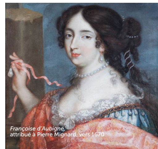
Françoise d'Aubigné, attribué à Pierre Mignard, vers 1670