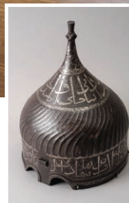
Casque turban Turquie/Iran, XV e siècle